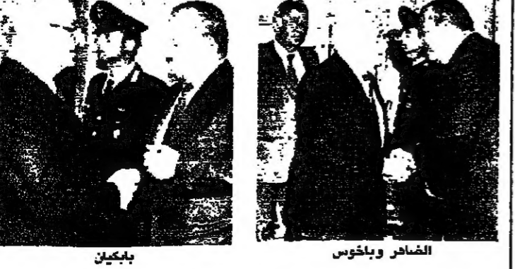
السفير البريطاني يرحب بالطارن ابي نذر